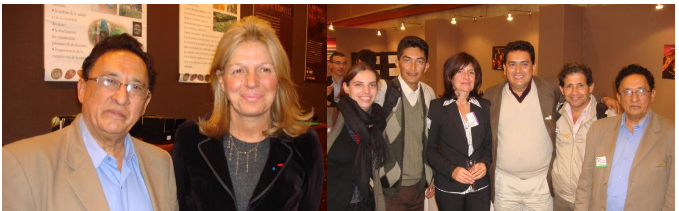
Directora del Salon de Chocolate y co-organizadora de Cacao de Excelencia / Representantes de Max Havelaar y CIRAD con grupo peruano