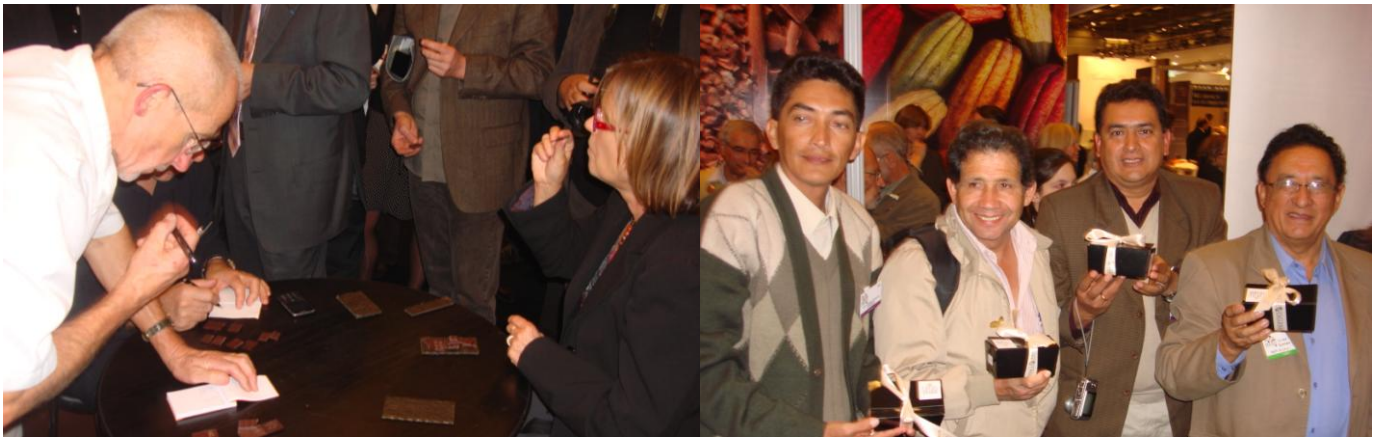
Investigadores internacionales catando chocolates elaborados con muestras participantes / Representantes de las organizaciones peruanas ganadoras (CAI TOCACHE, ACOFAGRO, CAC ORO VERDE, ARPROCAT)